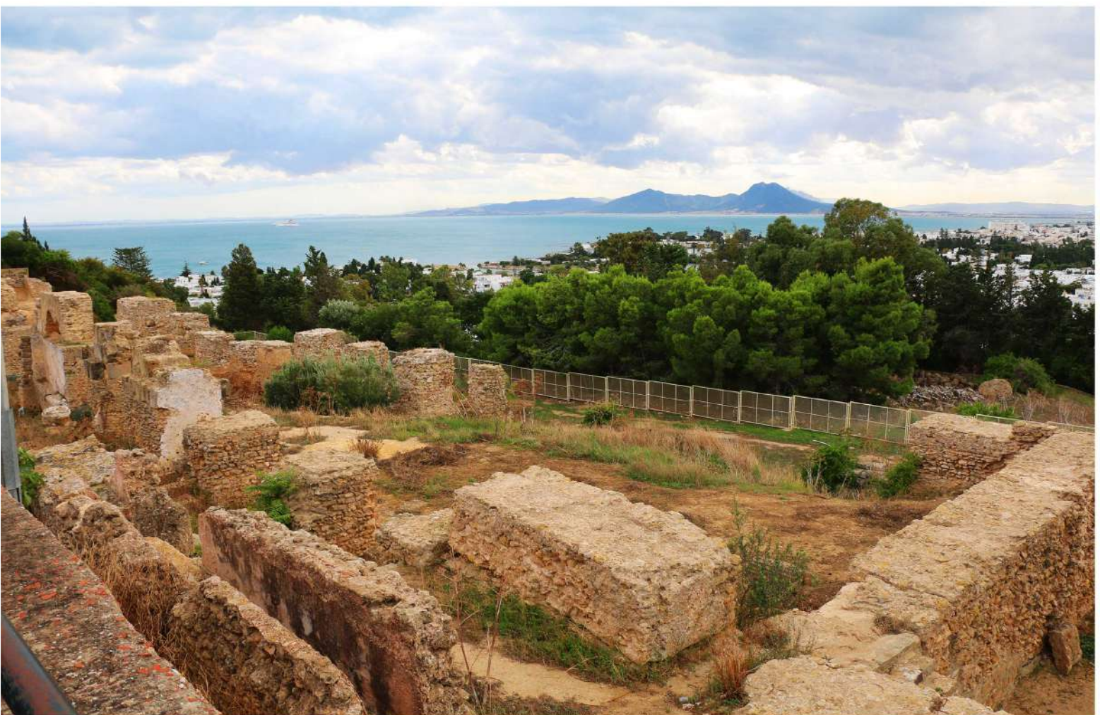
© UIK - Site archéologique de Carthage - Quartier punique