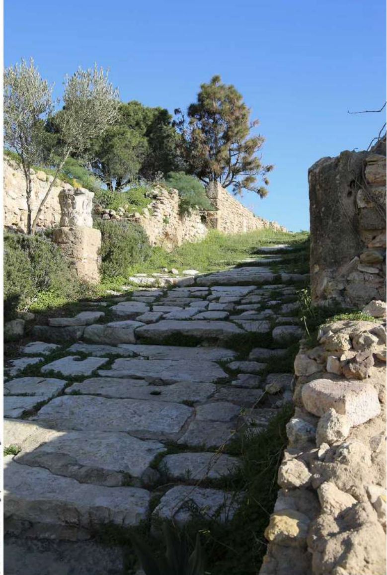
Site archéologique de Carthage

Allant du nord au sud, la Tunisie dispose d'un patrimoine archéologique riche et varié. Ces fabriques spatiales témoignent aujourd'hui du brassage culturel important qu'a connu le pays. Carthage, le site archéologique qui constitue l'objet d'étude pratique de ce workshop, a été inscrit depuis 1979 sur la liste du patrimoine mondial de l'UNESCO. En effet, cet ensemble archéologique a été fondé « dès le IX e siècle av. J.-C. sur le golfe de Tunis, Carthage établit à partir du VI e siècle un empire commercial s'étendant à une grande partie du monde méditerranéen et fut le siège