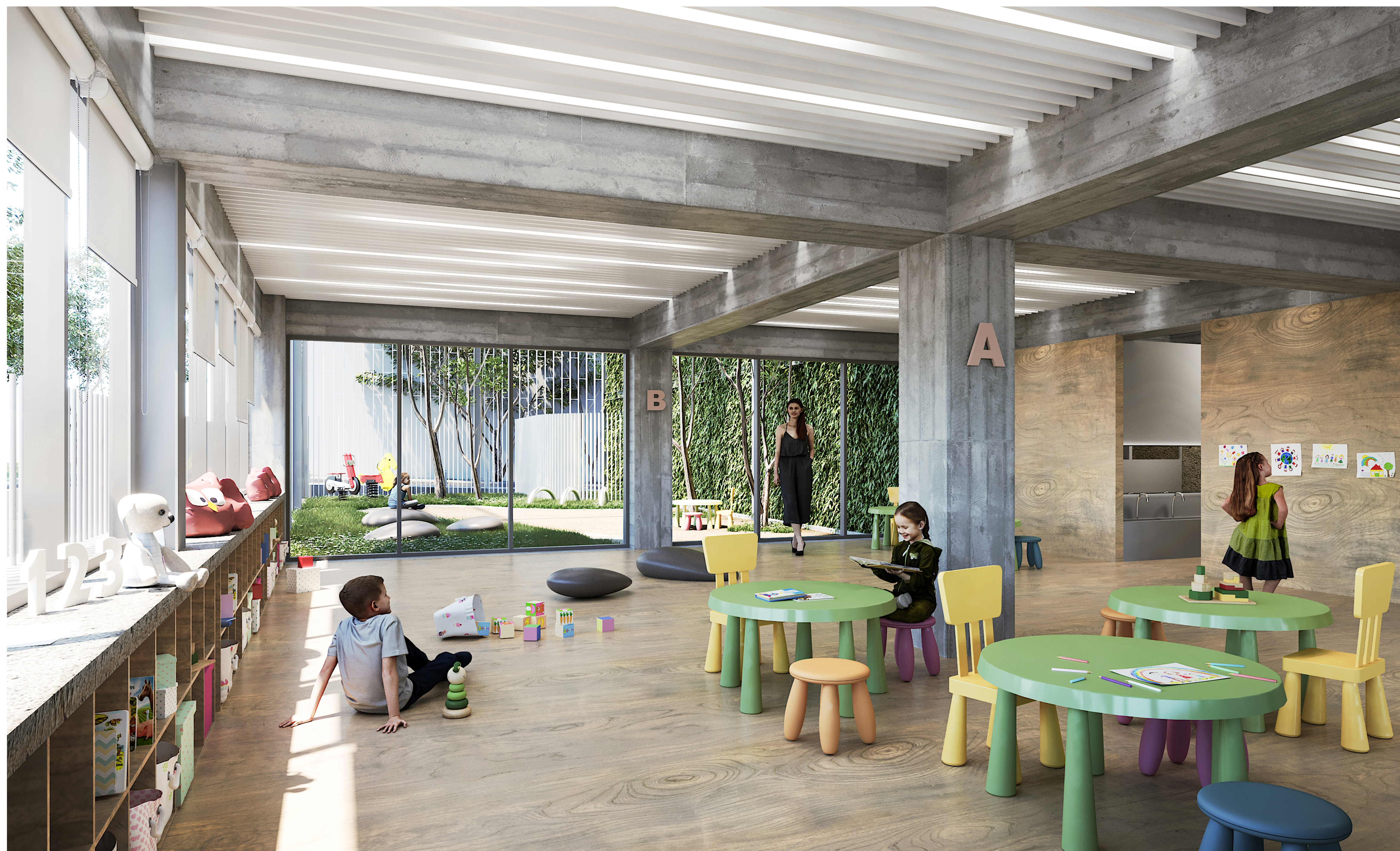
ΑΠΟΨΗ ΑΠΟ ΤΟΝ ΕΣΩΤΕΡΙΚΟ ΧΩΡΟ ΤΗΣ ΑΙΘΟΥΣΑΣ ΝΗΠΙΩΝ