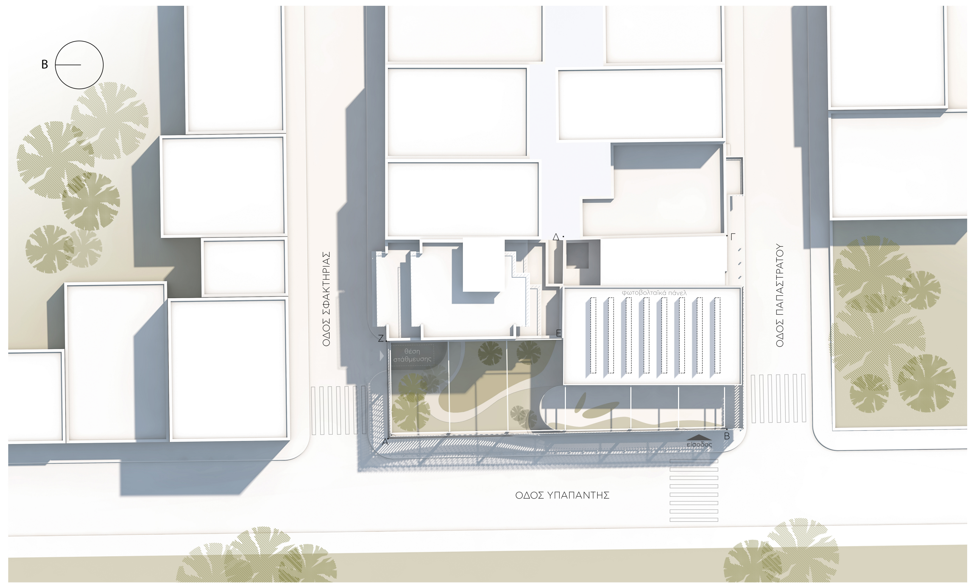
ΤΟΠΟΓΡΑΦΙΚΟ ΔΙΑΓΡΑΜΜΑ ΚΛΙΜΑΚΑ 1:200

Το πέτασμα της όψης δημιουργεί μια αίσθηση προστασίας στα παιδιά και εντείνει την αίσθηση του εσωτερικού κήπου - δωματίου. Οι λευκές κόβητες περσίδες ανακλούν εσωτερικά το δυτικό φως και το διασκέδον δημιουργώντας μια αίσθηση ενός πράσινου κατάφυτου χώρου. Οι σπριζιές ανάμεσα στις κόβητες περσίδες είναι τμήματα χρωματιστών μετάλλων - σαν χρωματιστές χάντρες - που δίνουν ένα πολύχρωμο τόνο στο πέτασμα, όταν γίνεται αντιληπτό από κοντά.