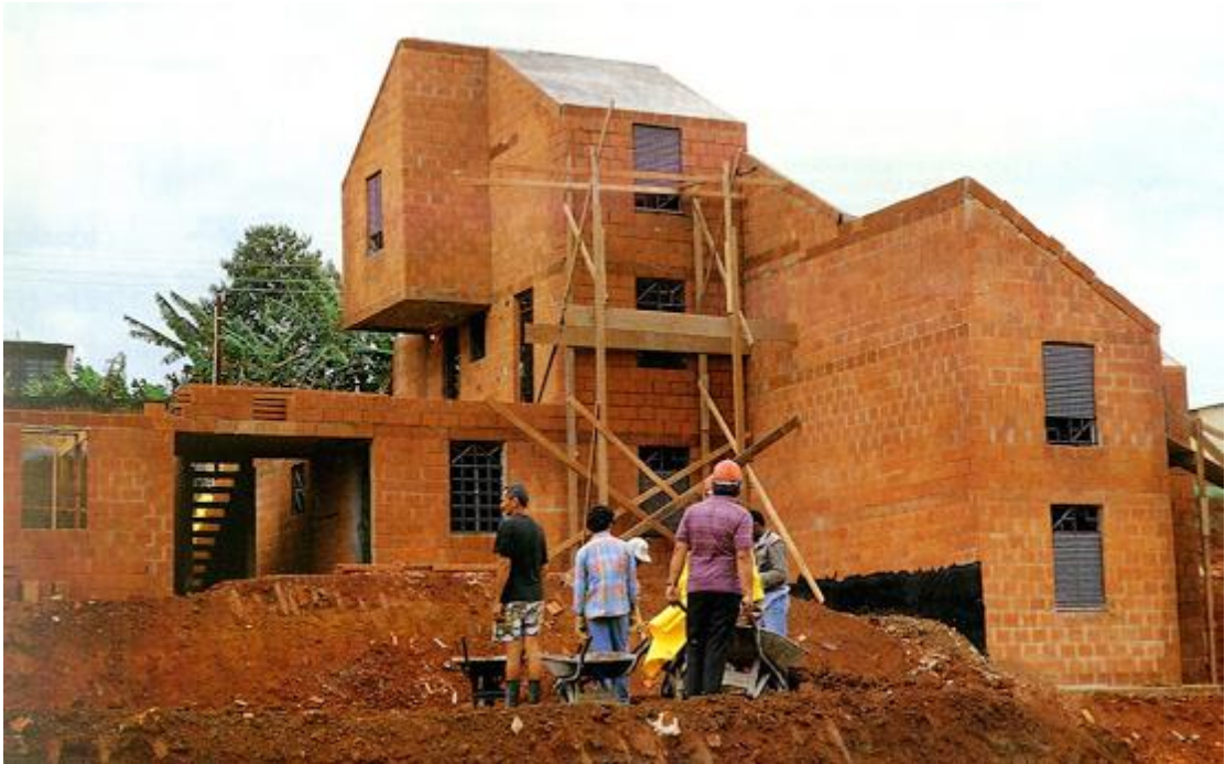
• Participatory construction of the São Francisco settlement in Sao Paulo, 1991