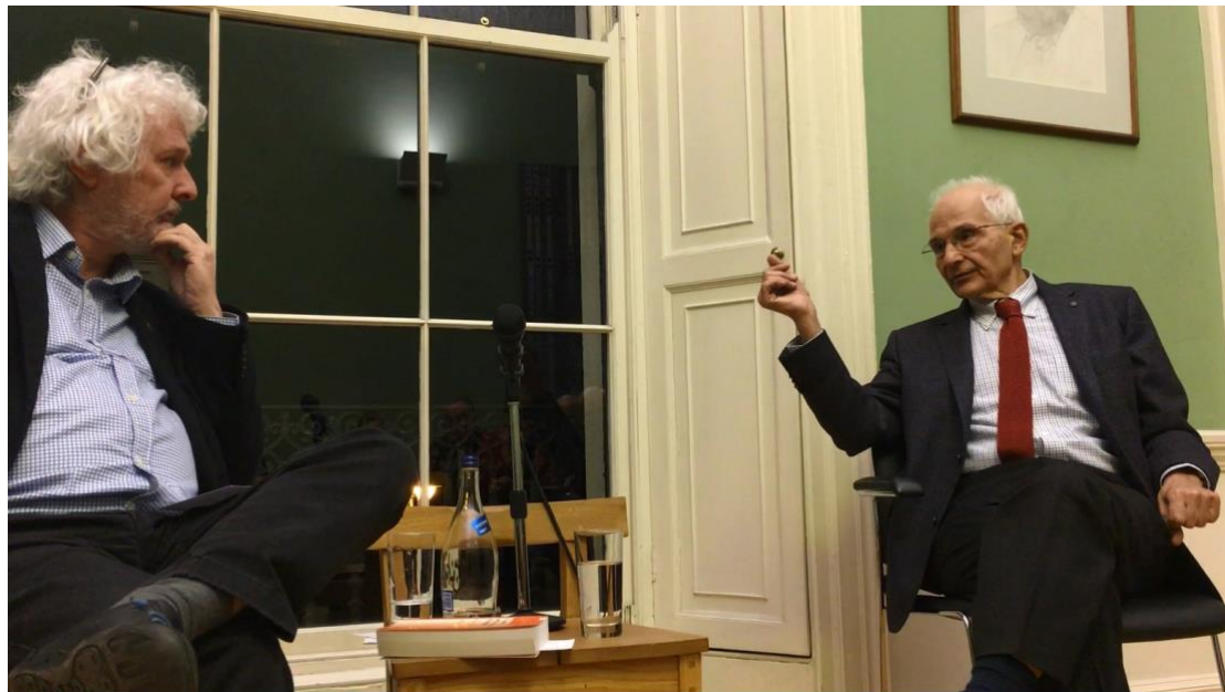
Φωτογραφία από την παρουσίαση του βιβλίου του αρχιτέκτονα Βασίλη Σγούτα στο Βασιλικό Ινστιτούτο των Αρχιτεκτόνων της Ιρλανδίας (Δουβλίνο, Νοέμβριος 2017). Ο συγγραφέας συνομιλεί με τον γνωστό αρχιτέκτονα, συγγραφέα και κριτικό Shane O'Toole