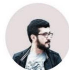
ΜΑΘΙΟΥΔΑΚΗΣ ΒΑΣΙΛΗΣ / MATHIOUDAKIS VASILIS [φωτογραφία / photography]