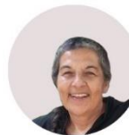
ΝΙΚΗΦΟΡΑΚΗ ΓΕΩΡΓΙΑ / NIKIFORAKI GEORGIA [ζωγραφική / painting]