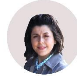
ΑΝΔΡΟΥΛΑΚΗ ΜΑΡΙΑ / ANDROULAKI MARIA [ζωγραφική / painting]