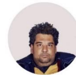
ΚΑΚΑΤΣΑΚΗΣ ΝΙΚΟΛΑΟΣ / NIKOLAOS KAKATSAKIS [κατασκευή / installation] [ζωγραφική / painting]

+ Λ Π Ο Χ Ξ 13 Η Η Σ Σ Υ Μ Μ Ε Τ Ξ Ο Υ Ν +