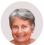
ΓΕΩΡΓΑΚΑΚΗ ΠΑΤΡΙΣΙΑ / GEORGAKAKI PATRICIA [κατασκευή / installation]