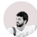
ΝΕΥΡΑΔΑΚΗΣ ΜΙΧΑΗΛ / NEVRADAKIS MICHAIL [φωτογραφία / photography]