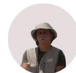
ΠΕΡΡΑΚΗΣ ΝΙΚΟΣ / PERRAKIS NIKOS [ζωγραφική / painting]