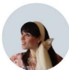
ΣΚΟΥΛΟΥΔΗ ΗΡΩ / ΣΚΟΥΛΟΥΔΙ ΙΡΟ [κατασκευή / installation]