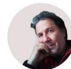
ΤΣΟΥΚΑΤΟΣ ΙΩΑΝΝΗΣ / ΤΣΟΥΚΑΤΟΣ ΙΟΑΝΝΙΣ [ζωγραφική / painting]