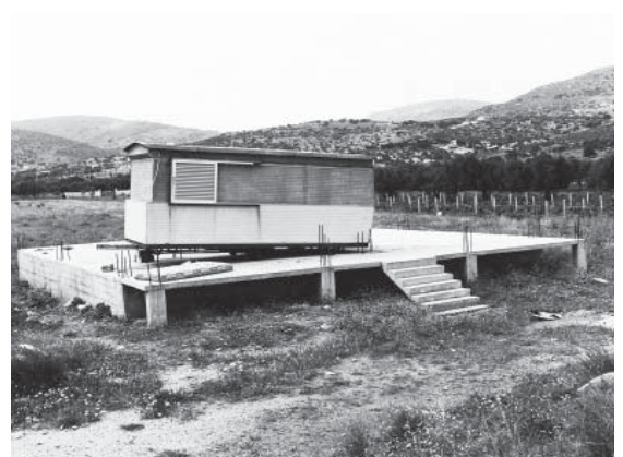
Γιάννης Θεοδωρόπουλος, από τη σειρά The Greek Party, 2013