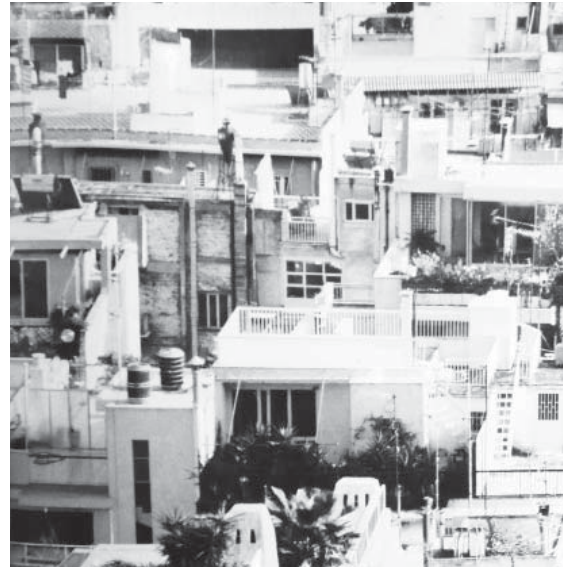
άποψη της Αθήνας, 2001

(Α) Βατή κατασκευή από σπλισμένο σκυρόδεμα. Καλύπτει μέρος του δαπέδου και εξωτερικού του ελληνικού περιπτέρου. Απαρτίζεται από περιοχές-επικράτειες του μοντέρνου. Είναι ανάγλυφο διάγραμμα, βατό πρόπλασμα και τοπίο δεδομένων. Η γεωμετρία, υφή, κατασκευή και όγκοι του καταγράφουν ποσοτικά μεγέθη του κτηριακού αποθέματος του ελληνικού Domino 1 (Όψη, Δώμα, Σκελετός, Κατακόρυφος Πυρήνας, Οριζόντια Ιδιοκτησία, Ακάλυπτος, Τομή Δρόμου, Οικοδομικό Τετράγωνο, Αδρανή Τοπία, Οριακά-Εκτός Σχεδίου Κτίσματα). Τα αυτόνομα τμήματά του καλουπώνονται, σιδερώνονται και χύνονται in situ.