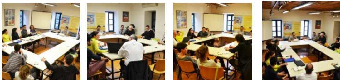
Κείμενα: Νεκτάριος Κεφαλογιάννης

Η συζήτηση που ακολούθησε της παρουσίασης της κάθε πρότασης βοήθησε στην επίτευξη μεγαλύτερης συνοχής ανάμεσα στις προτάσεις, αλλά και στη γρηγορότερη και εντονότερη εμβάθυνση στο σχεδιασμό, λειτουργώντας σε μεγάλο βαθμό καταλυτικά στην ωρίμανσή τους.