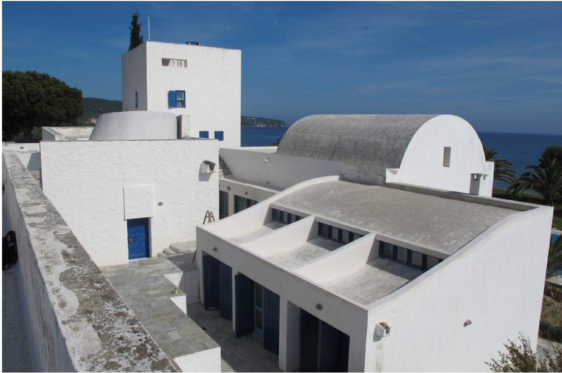
1. Γενική άποψη